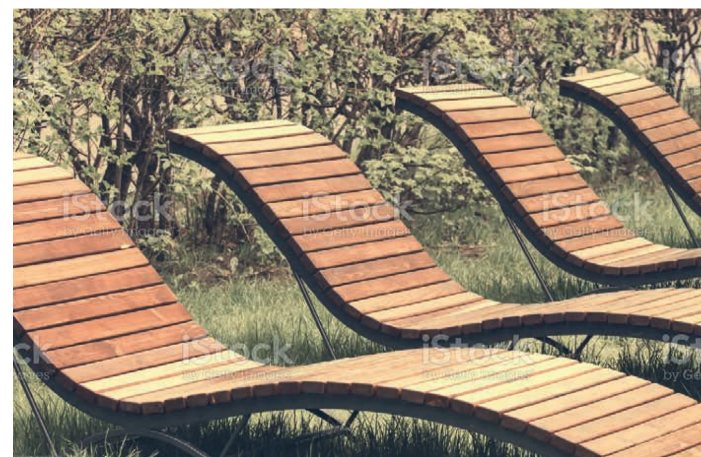
Exemple de transats en libre-service