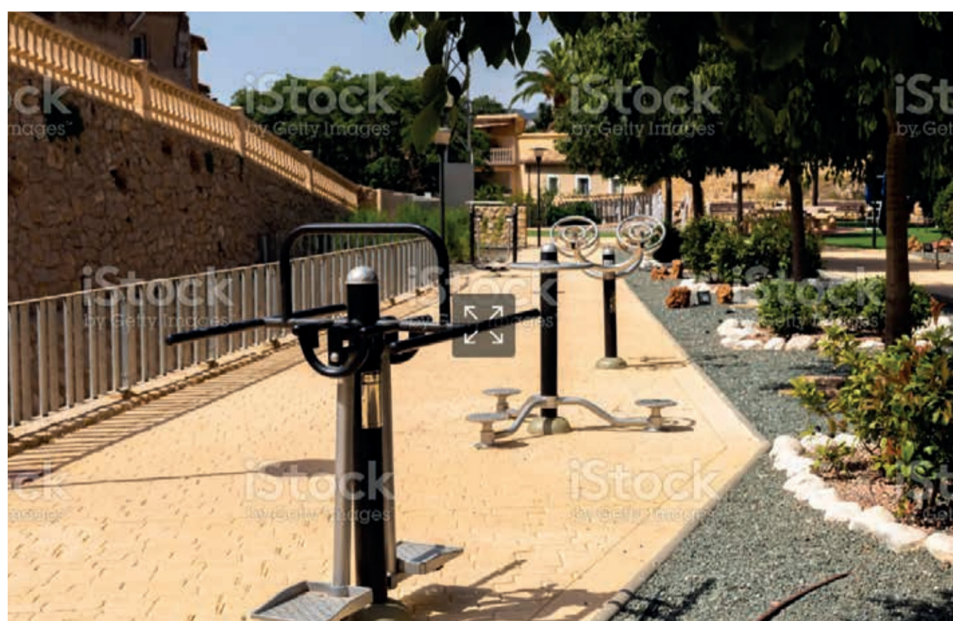
Exemple de parcours santé