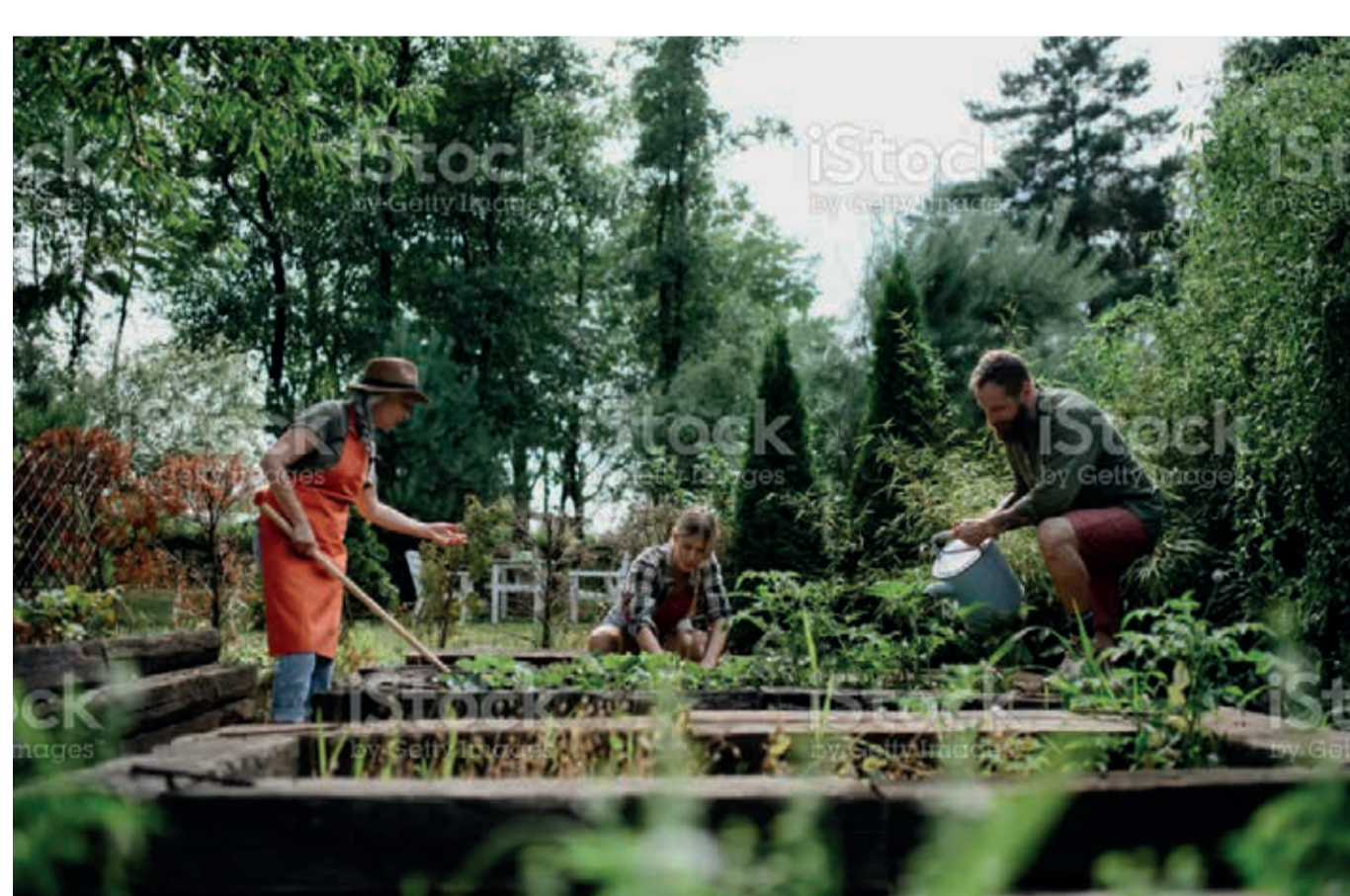
Exemple de potager participatif