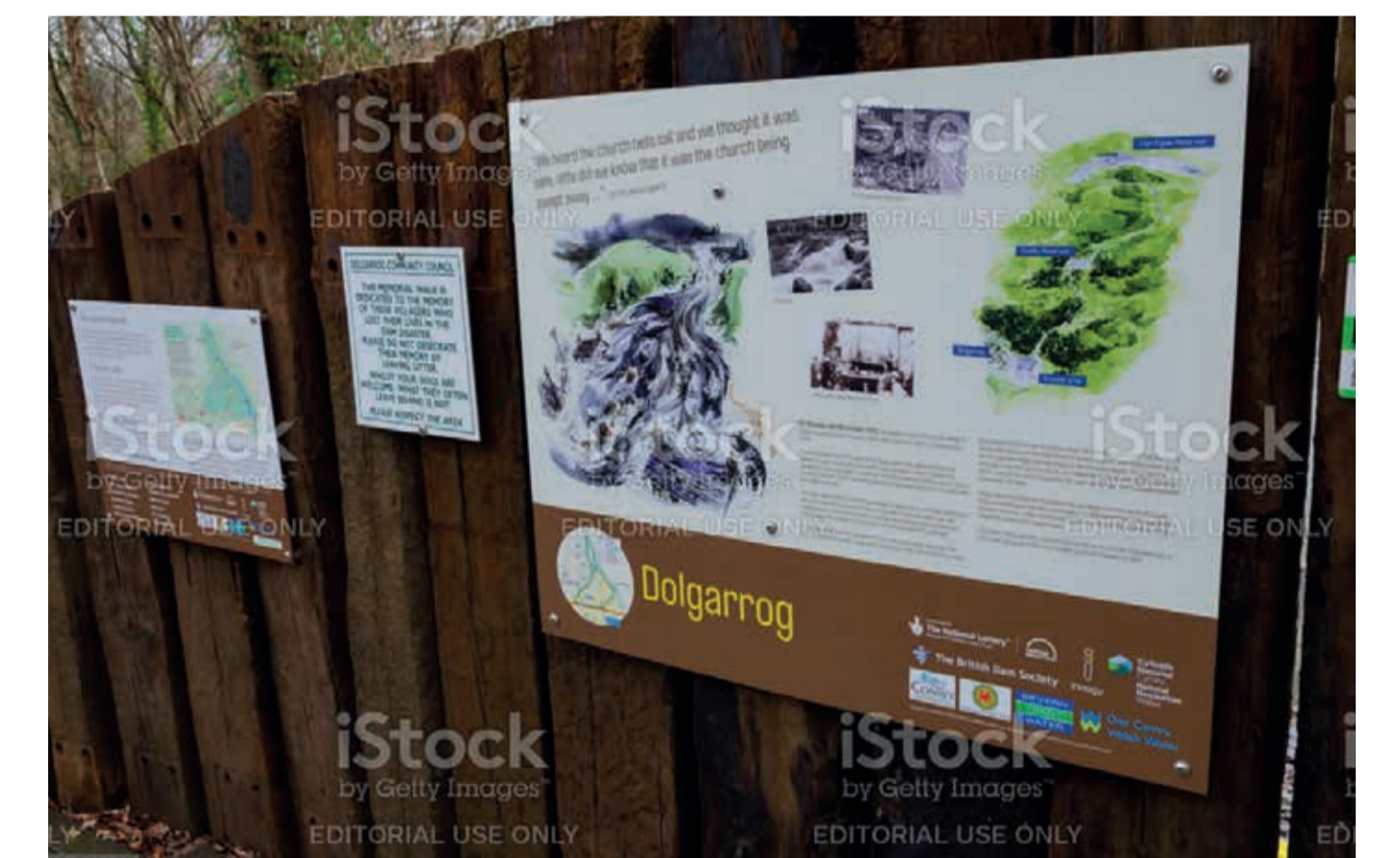
Exemple de table de panneaux éducatifs sur les enjeux environnementaux