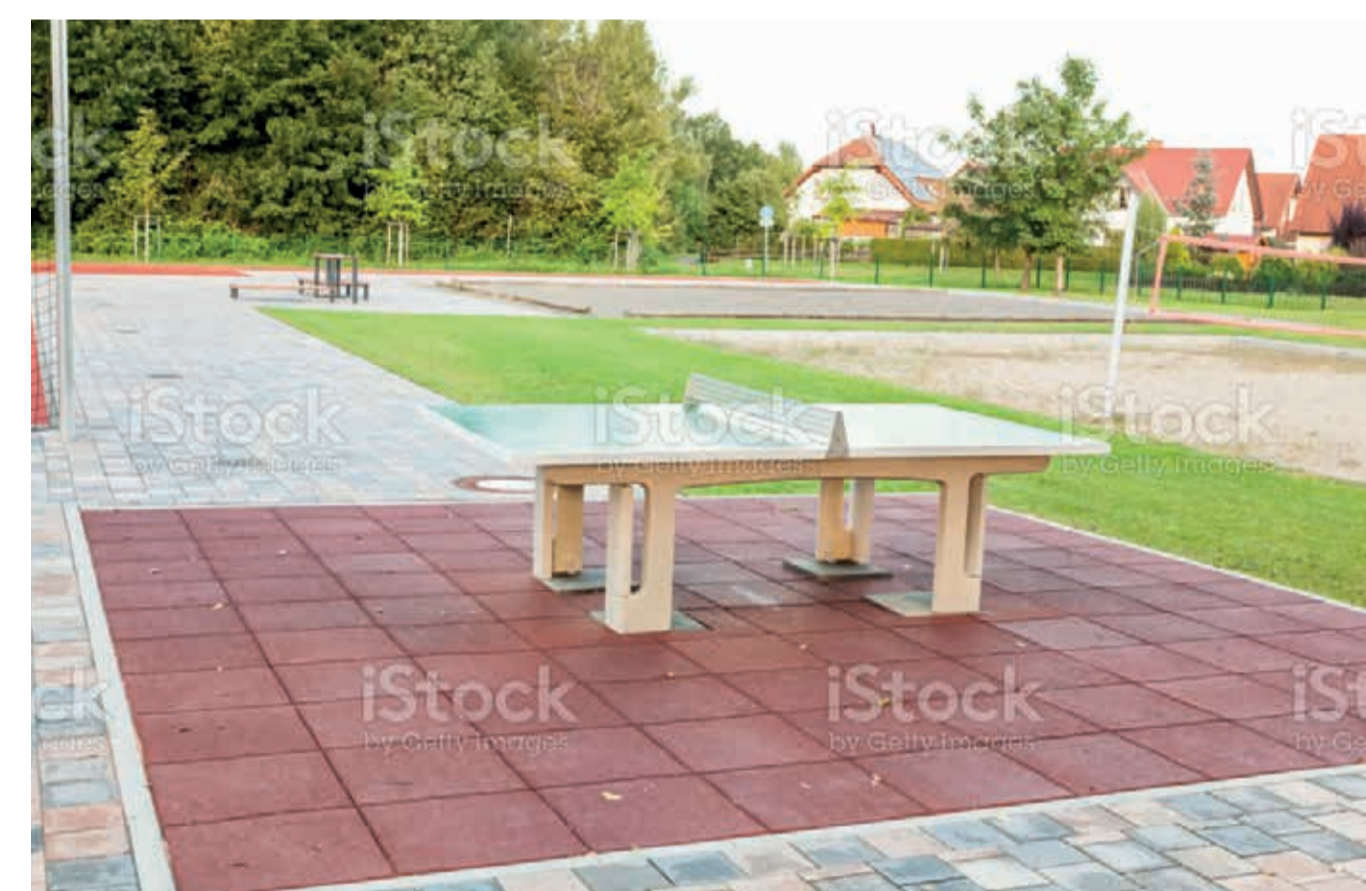
Exemple de table de ping-pong accessible pour tous