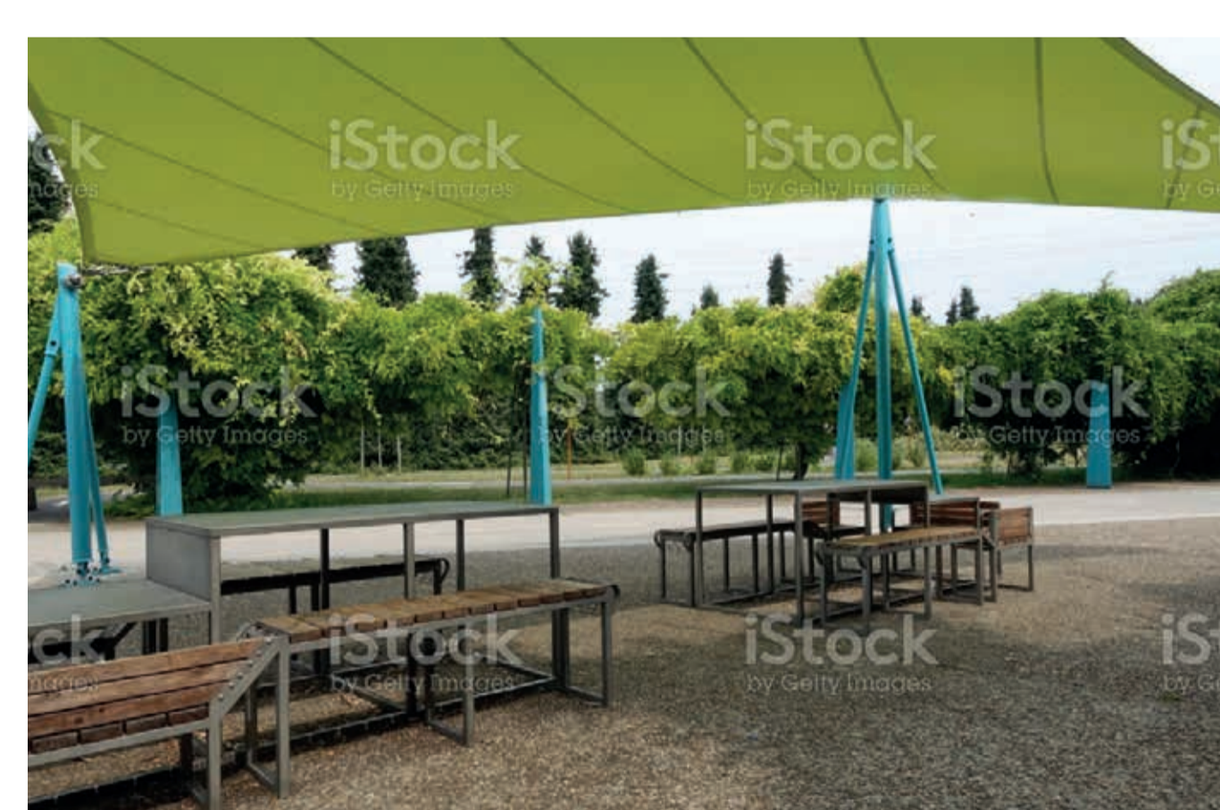
Exemple d'aire de pique-nique