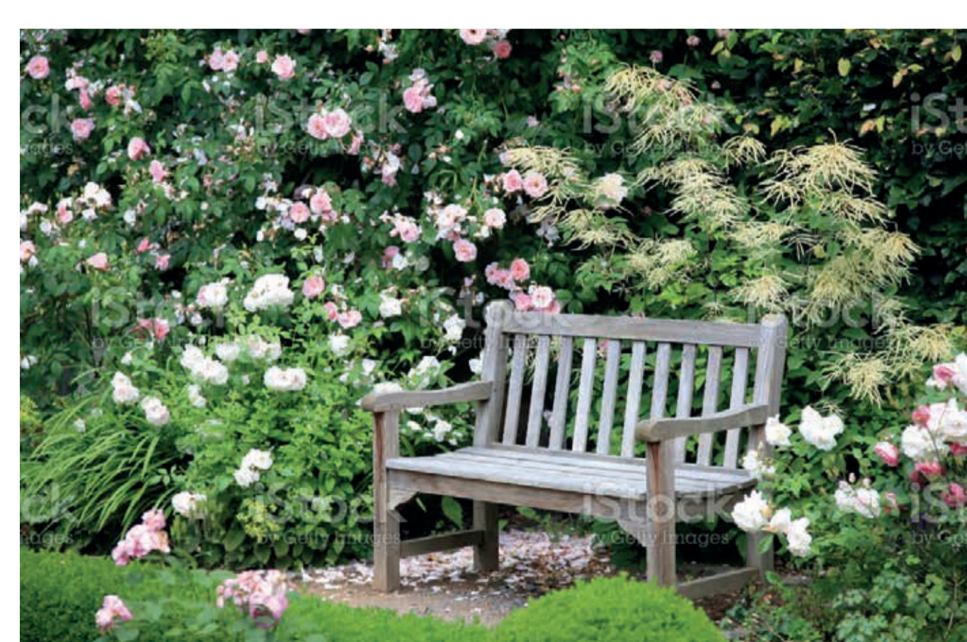
Exemple de banc individuel