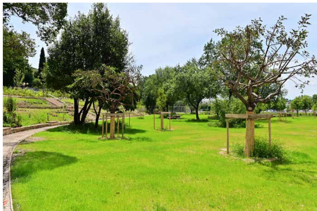
Exemple de prairies