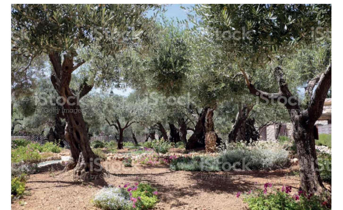
Exemple de végétation méditerranéenne