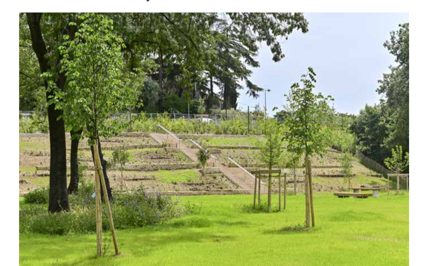
Exemple de prairies libre d'accès