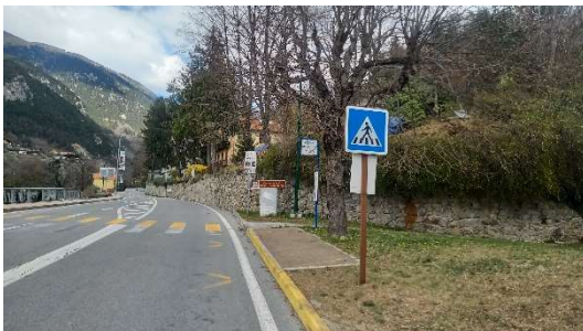
Abris bus - Photo du 03-04-2023