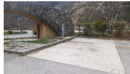
Aire camping-car - Photo du 03-04-2023