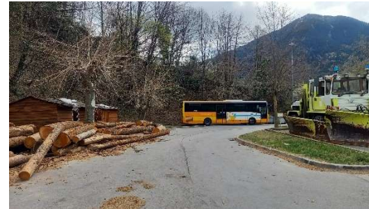
Site du TOURON - Photo du 03-04-2023