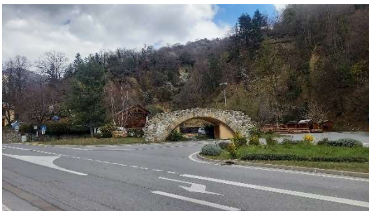
Site du TOURON - Photo du 03-04-2023

Ce site est positionné en bordure de la RM 2565 dont l'accès est direct, en partie bitumée, recevant des espaces verts de type jardinières, et en partie enherbés.