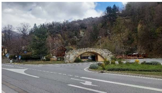
Site du TOURON - Photo du 03-04-2023