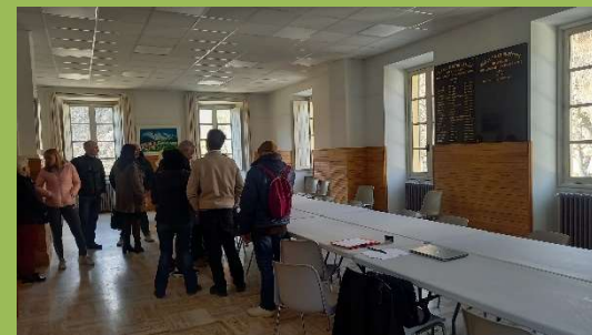
Permanence N°2 - Photo du 10-04-2023