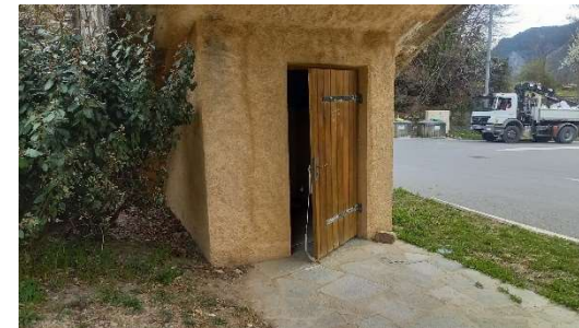
Toilette public - Photo du 03-04-2023