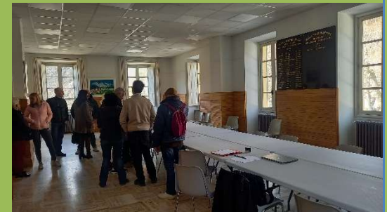
Permanence N°2 - Photo du 10-04-2023