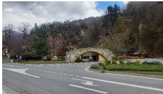
Site du TOURON - Photo du 03-04-2023