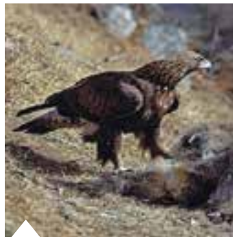
AIGLE ROYAL

Le site de l'Adret de Pra Gazé abrite une grande diversité d'espèces, dont huit espèces de faune et de flore d'intérêt communautaire c'est-à-dire des espèces citées dans l'annexe II de la Directive « Habitats » et les oiseaux nicheurs cités par la Directive « Oiseaux ». Le site est également une zone d'hivernage pour les ongulés sauvages. Cette faune a contribué à façonner le paysage du site.