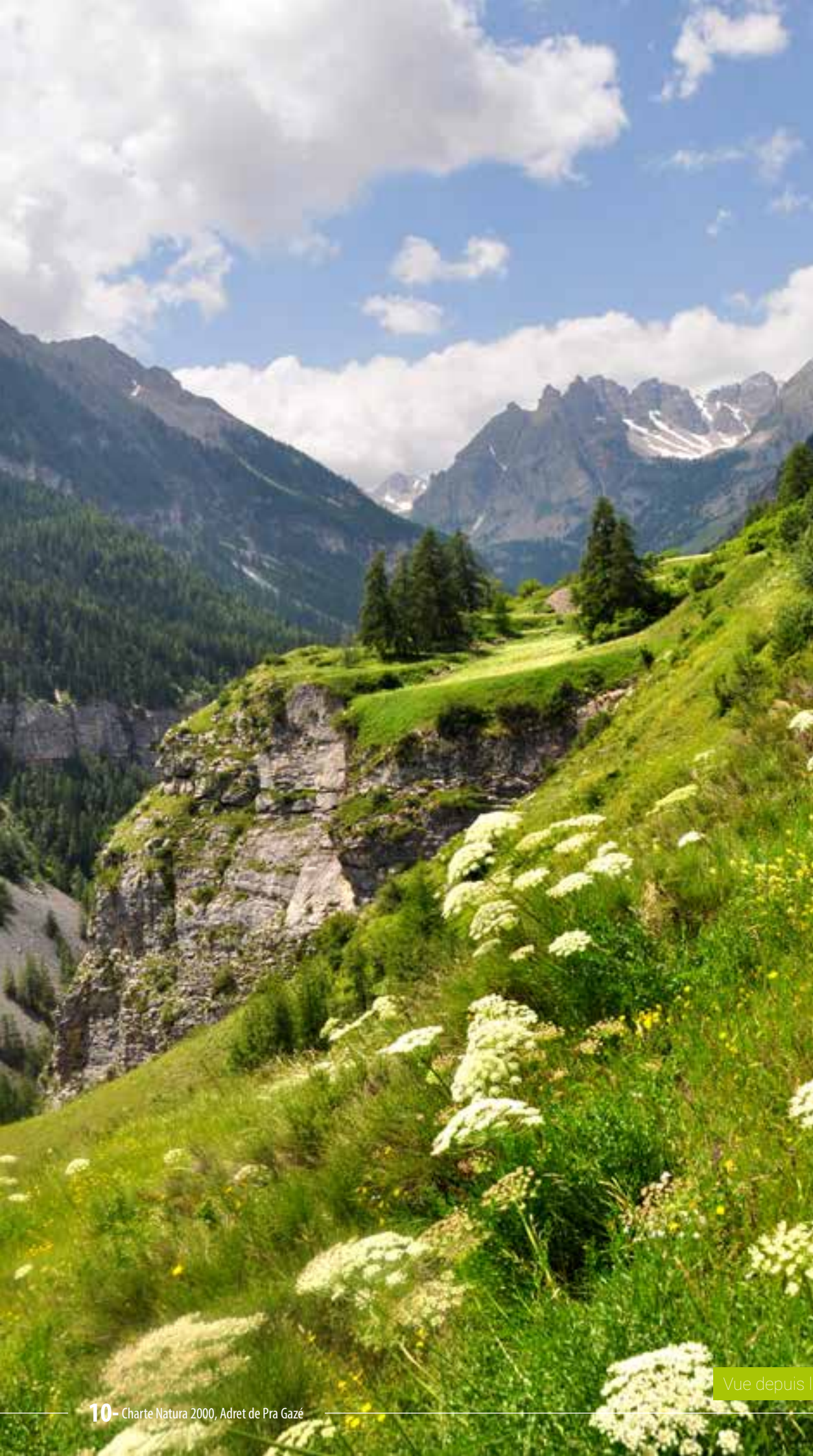
Vue depuis le Pra