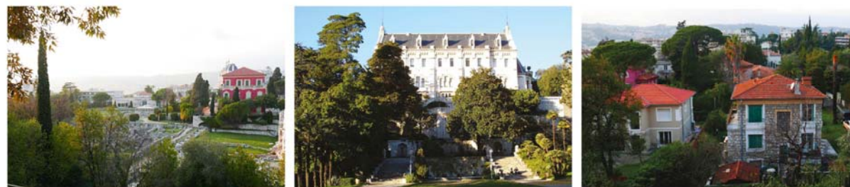
SECTEUR S3 «LES QUARTIERS DE VILLÉGIATURE DES COLLINES» Quartiers résidentiels des collines : Cimiez, Le Mont Boron, Les Baumettes, Le Piol.