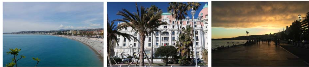
SECTEUR S1 «LA PROMENADE DES ANGLAIS» Première extension urbaine de la ville moderne.