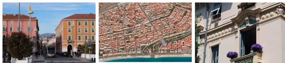
SECTEUR S2 «LES QUARTIERS DE VILLÉGIATURE DE LA PLAINE» Développement de la «ville moderne» selon le tracé régulateur du Consiglio d'Ornato.