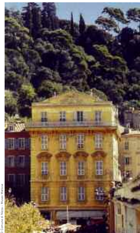
Immagine al n° 1 di place Charles-Félix, dove visse Matisse

Vi trovate di fronte al mare e proprio dietro di voi, il Cours Saleya , animato e colorato, vi attira irresistibilmente. Alla sua estremità, sulla place Charles-Félix , notate un bell’edificio. Matisse vi ha vissuto, una prima volta al terzo piano, una seconda al quarto in un appartamento più ampio che domina tutta la Baie des Anges.