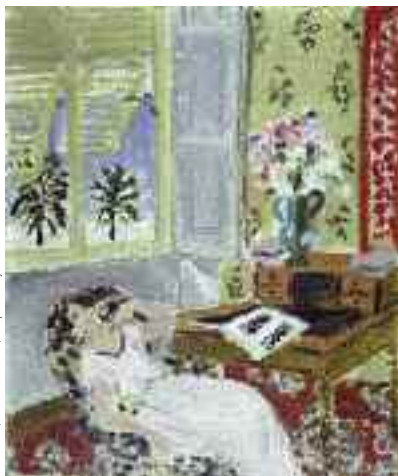
« Interno a Nizza - la siesta », 1922 olio su tela, 66 x 54,5 cm Mnam / Cci, G.Pompidou, Paris

Nel 1918, L' Hôtel de la Méditerranée et de la Côte d'Azur , oggi scomparso, è la sua nuova residenza. Matisse vi risiede per quattro anni conserverà a lungo il ricordo di questo luogo che lo ispirò tanto. Ritrovando il lusso di un tempo, il Palais de la Méditerranée , situato sulla Promenade des Anglais, si rinnova e ritrova il proprio splendore.