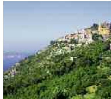
Eze Village La Cittadella di Villefranche-sur-Mer La Villa Kerylos a Beaulieu-sur-Mer