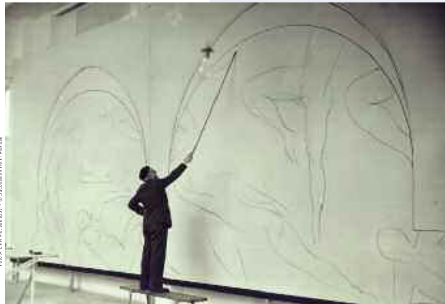
Atelier di Matisse a Nizza, via Désirée Niel