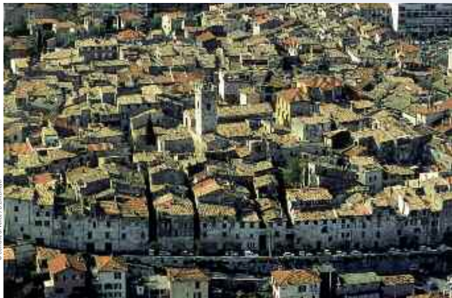
La Cittadella Storica di Vence