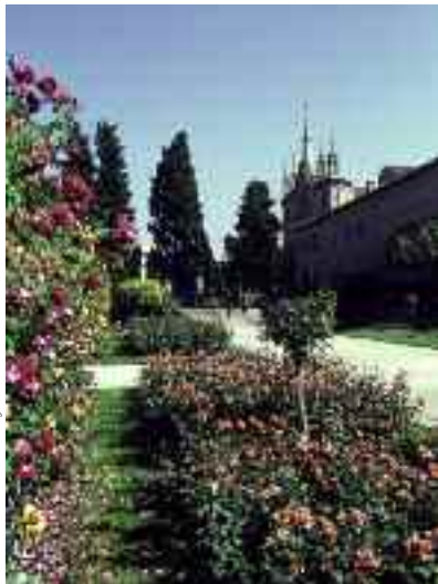
Il roseto del Monastero di Cimiez

Lasciate il lungomare per dirigervi verso Cimiez . Nelle vicinanze del Liceo Masséna, potete scorgere la rue Désirée-Niel. Al numero 8 di questa piccola strada Matisse ha preso possesso nel 1931 di un vecchio