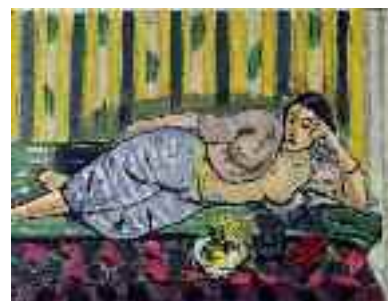
«Odalisca con cofanetto rosso», 1926 olio su tela, 50 x 65 cm - Museo Matisse, Nizza