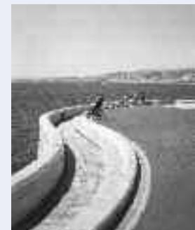
Raubu Capeu, Nizza

Tratto d'unione fra il quai des Ponchettes e il porto, questa gettata sul mare possiede un'architettura risolutamente contemporanea, ricompensata da un gran premio d'urbanistica, e offre a chi passeggia dei punti di vista impareggiabili.