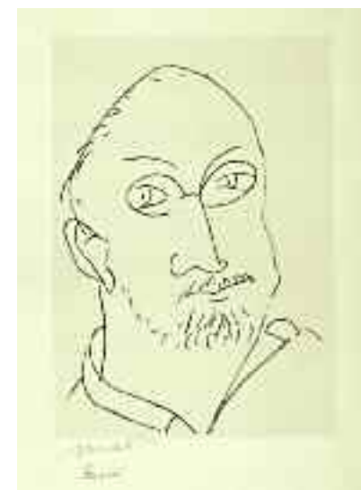
« Autoritratto - Grande Maschera », 1944 litografia, 53.9 x 37.9 cm Museo Matisse, Nizza