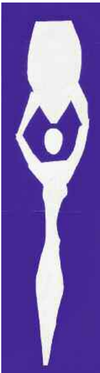
© Succession H. Matisse