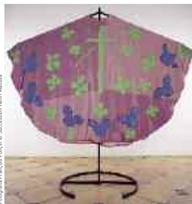
Fotografia François Perçin © Succession Henri Matisse