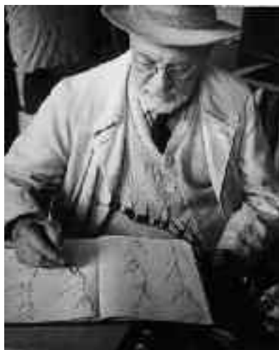
« il Carnet di disegni », 1946 Fotografia bianco e nero - Museo Matisse, Nizza

percepire il suo carattere fiero, non bisogna perdersi niente delle sue tante stradine scoscese, delle sue case, le più antiche delle quali risalgono al XV secolo, delle sue scalinate ornate di fiori. Ad ogni passo, un nuovo