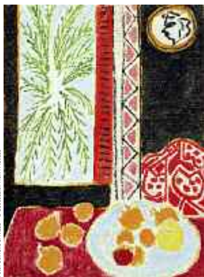
« Natura morta con melagrane », 1947 olio su tela, 80,5 x 60 cm - Museo Matisse, Nizza

Nel 1943, Matisse affitta la villa “Le Rêve” a Vence per allontanarsi per qualche tempo da Nizza, minacciata dai bombardamenti. La sua prima intenzione è di rimanervi solo alcune settimane, ma, toccato