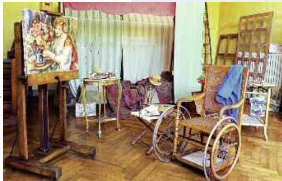
Atelier Renoir nel Museo Renoir