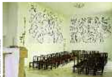
Fotografia Comune di Nizza - Museo Matisse © Succession Henri Matisse