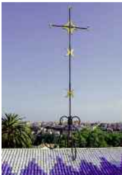
Fotografia H. Del Olmo - © Succession Henri Matisse