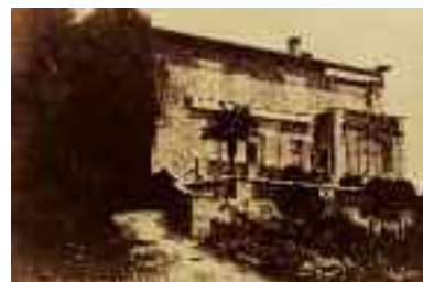
La Villa delle Collettes nel 1917 e ai giorni nostri