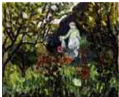
« Giardino di Renoir », 1925 - Olio su tela, 37,8 x 46 cm - Svizzera, Collezione privata

Il 31 dicembre 1917, Matisse rende visita al pittore Pierre-Auguste Renoir nella sua Villa delle Collettes . Questo incontro, che incanta entrambi, sarà seguito