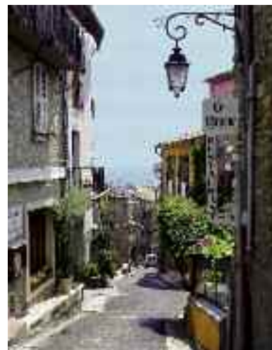
Stradina di Haut-de-Cagnes

Ulivi, giardino di Renoir a Cagnes, 1917 - Paesaggio di Cagnes prima della tempesta, verso il 1918 - L'autunno a Cagnes, 1918 - Casa fra gli alberi, 1919.