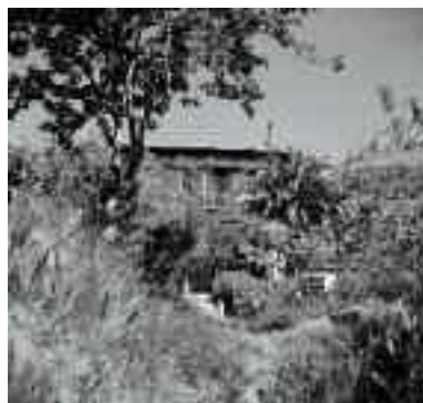
La Villa “Le Rêve” nel 1943 e ai giorni nostri