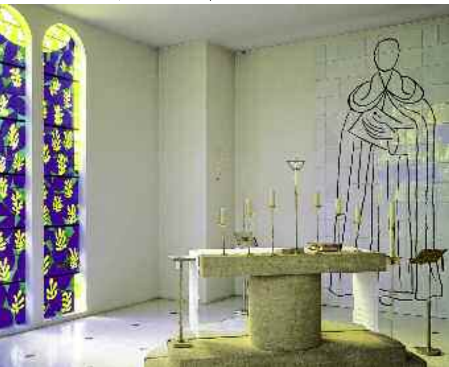
Fotografia H. Del Olmo - © Succession Henri Matisse

Cappella del Rosario, Vence Vetrata del santuario, altare e Saint Dominique