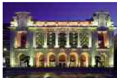
Nizza e la Baie des Anges