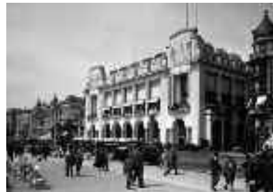
Il Palais de la Méditerranée, 1935 E il Palais de la Méditerranée oggi