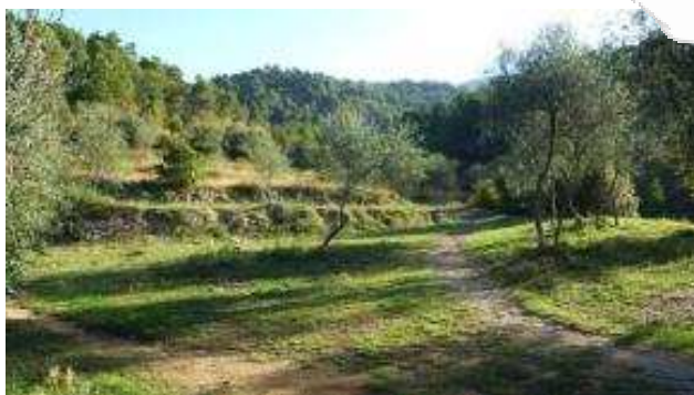
Jardin éco-paysager de Levens

http://www.nicecotedazur.org/environnement/agenda-21/